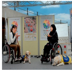
介助犬フェスタ (昨年の様子)