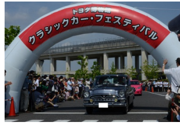
トヨタ博物館 クラシックカー・フェスティバル (昨年の様子)