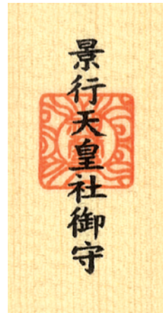
合格乗車証の両面（お守りの袋の中に入ります）