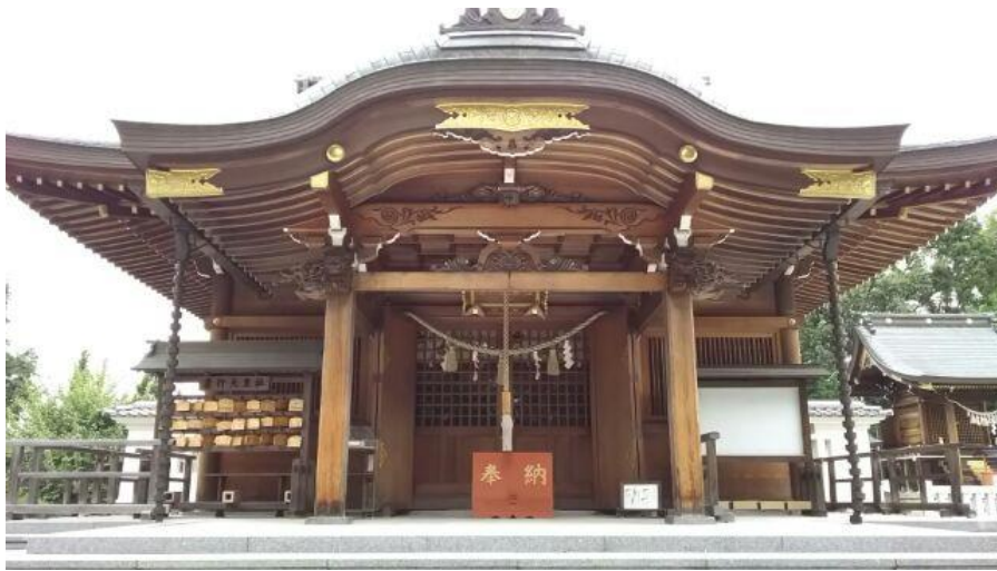
「リニモ合格祈願お守り」をご祈祷いただく長久手市の景行天皇社

また、「リニモ合格祈願お守り」の発売に合わせ、リニモ車内において参加される受験生皆様の合格祈願を行う「リニモ合格祈願列車」を運行します。受験生の皆様には是非、ご乗車いただくとともに、「リニモ合格祈願お守り」が皆様のお力になれることを願っています。