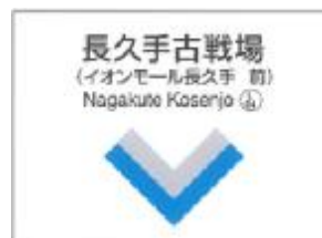
駅名看板（イメージ）