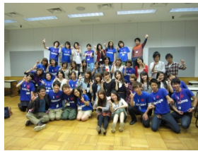
リニモ沿線合同大学祭 実行委員

はなみずき通駅 → 景行天皇社 → せせらぎの径 → 古戦場公園 → トヨタ博物館 → モリコロパーク (愛・地球博記念公園駅)