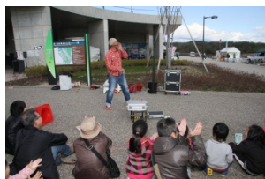
モリコロパーク春まつり (写真は昨年の様子)

リニモ八草駅 → あいち海上の森センター → 愛・パーク → 愛知県陶磁資料館 → モリコロパーク (愛・地球博記念公園駅)