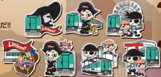
※7種類のうち、いずれか1つ

無事にゴールにたどり着いた者には、愛・地球博記念公園駅で先着1万名様にオリジナル海賊ピンバッジが褒美として渡される!