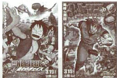
© 尾田栄一郎 / 「ワンピース3D」制作委員会 © 島尻光年 / 「トリコ」制作委員会

※往復はがきでのお申し込みは1通につき、1申し込みとしてください。 ※お申し込みにあたっていただいた個人情報等は、ツアーに関する連絡などに利用し、 他の目的に利用することはありません。 ※ツアー中の事故・負傷等に際しては、責任を負いかねますのでご了承ください。 ※陶磁資料館南駅で解散となります。帰路の交通費は各自でご負担願います。