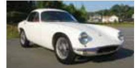
▲ロータス エリート(1961・イギリス)