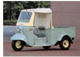
▲ダイハツミゼットDKA型(1959・日本)