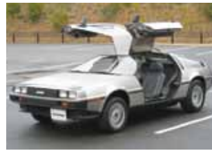
▲デロリアン(1982・アメリカ) ○パックードトゥエルヴ(1939・アメリカ) [ルースベルト大統領専用車] ○メルセデスベンツ300SLクーペ(1955・ドイツ)

走行披露 11:30頃~12:00 園内パレード時にも2部にわかれて走行します。