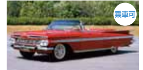
▲シボレー インパラ(1959・アメリカ)