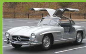
メルセデス ベンツ 300SL クーペ (1955・ドイツ)