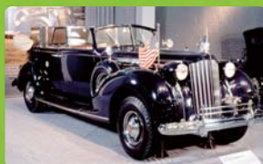
パカードトゥエルヴ (1939・アメリカ) [ルーズベルト大統領専用車]