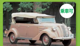
トヨタ AB型フェイトン(1936・日本)