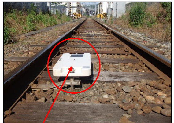
トランスポンダ地上子