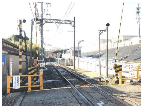
(桑町第3号踏切道と四十九駅)

平成30年3月17日に開業した新駅「四十九駅」付近の線路が急勾配であり、駅のすぐ近くに踏切があることから、停車中の列車の後退を検知して自動的に列車を停止させる「後退防止用ATS」を当社として初めて設置いたしました。