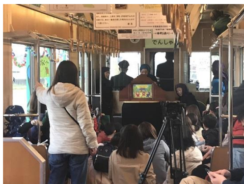
(おはなしでんしゃの車内)

沿線地域の賑わいづくりに協力するべく、沿線の施設や団体と共同で様々なイベント列車の運行やイベントの開催を行っています。平成30年度は、伊賀市上野図書館と共同での「おはなしでんしゃ」運行、伊賀市を本拠とする女子サッカーチーム「伊賀FCくノー」の選手による忍者市駅一日駅長イベント、国土交通省木津川上流河川事務所等と共同での「忍者列車で行く上野遊水地巡りの旅」などを行い、たくさんのお客様に沿線地域の魅力を堪能していただきました。