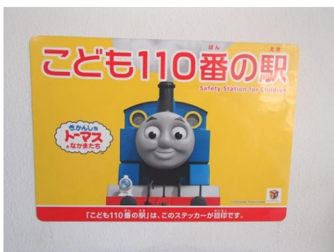
(こども110番の駅のステッカー)

伊賀市と協力して、伊賀市内の小学校や幼稚園・保育所（園）の児童・園児を対象に「電車の乗り方教室」を開催し、子どもたちの当社への関心を高めるとともに、電車利用に対するマナーを身につけてもらう取り組みを行っています。平成30年度は4回開催し、計113人の子供たちが参加しました。