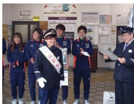
(忍者市駅一日駅長の任命式)