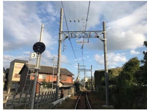
(コンクリート柱への更新後)