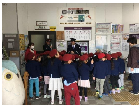
(電車の乗り方教室の様子)