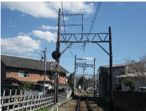
(更新前の架線柱：木柱)

線路・駅舎・踏切等の施設や車両に関しては、伊賀線の第三種鉄道事業者であり、施設・車両の所有者である伊賀市から委託を受け、当社が保守管理や更新工事を行っています。