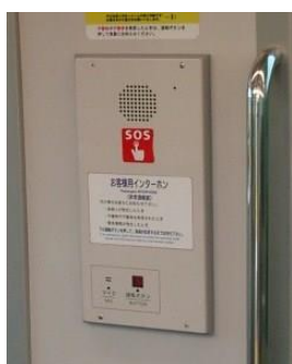
お客様用インターホン