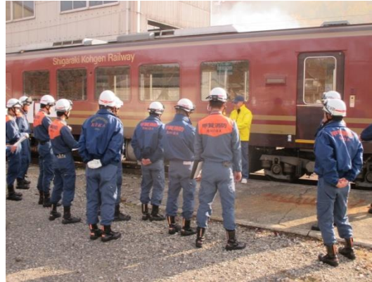
信楽消防署との総合事故復旧訓練