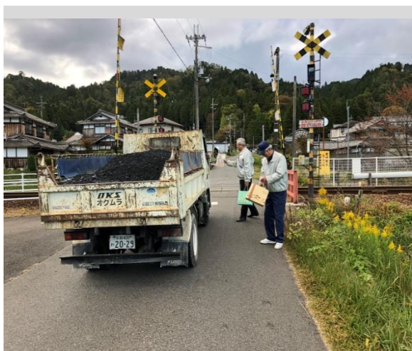
踏切事故防止キャンペーン

ます。合わせて、踏切・橋梁等の異常を発見されたときは、現地に表記しております「信楽高原鐵道への連絡先」へ御連絡頂きますようお願いいたします。