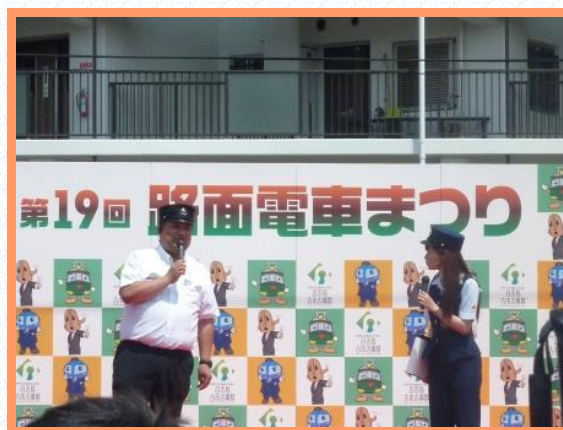
● 第19回 路面電車まつり