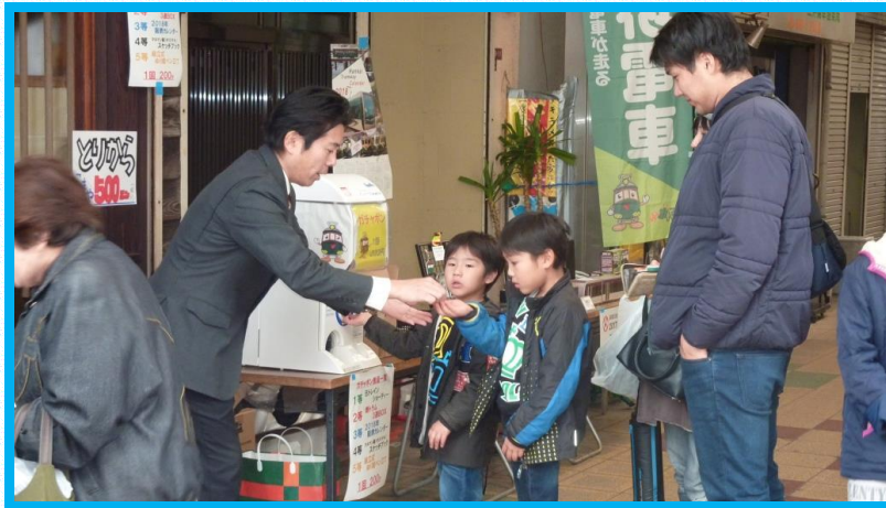
● あびこ道商店街にぎわい祭り