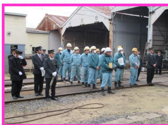
● 総合事故復旧訓練(各部門)