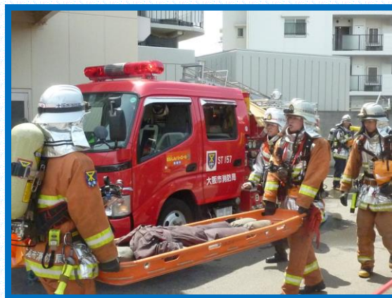
● 住吉消防署との合同訓練