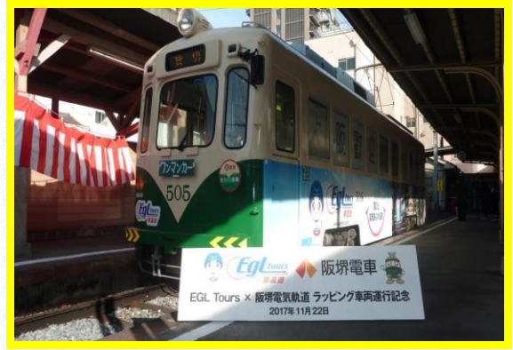
● EGL Tours × 阪堺電気軌道ラッピング車両運行記念