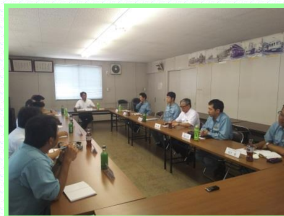
● 安全ミーティング