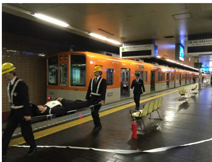
列車火災訓練 平成26年12月5日（高速神戸駅にて）

また、平成26年12月から平成27年1月に実施された「年末年始の輸送等に関する安全総点検」期間前には、高速神戸駅で終電後に行われた列車火災時訓練に立ち会うなどし、第二種鉄道事業者とともに輸送の安全確保に向けての取組・確認に努めました。