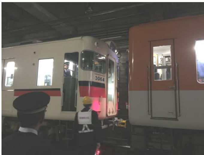
三社合同推進運転訓練 平成27年12月4日（新開地駅・高速神戸駅間にて）

また、平成27年12月から平成28年1月に実施された「年末年始の輸送等に関する安全総点検」期間前には、新開地駅・高速神戸駅間で終電後に行われた三社（阪神電気鉄道・阪急電鉄・山陽電鉄）合同推進運転訓練に立ち会うなどし、第二種鉄道事業者とともに輸送の安全確保に向けての取組・確認に努めました。