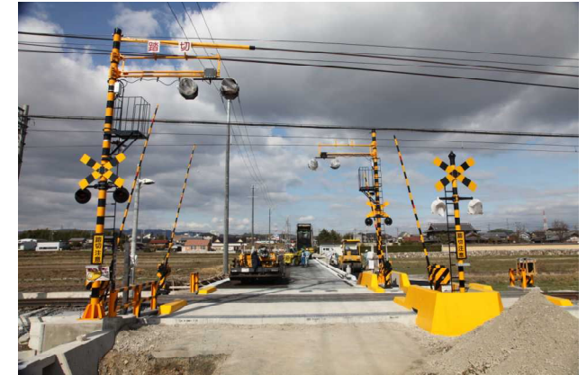
穴太 3 号踏切歩道新設工事(2010.3.8)