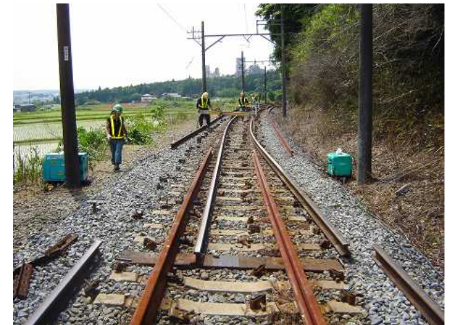
東藤原～西藤原間レール交換工事(2009.9.4)