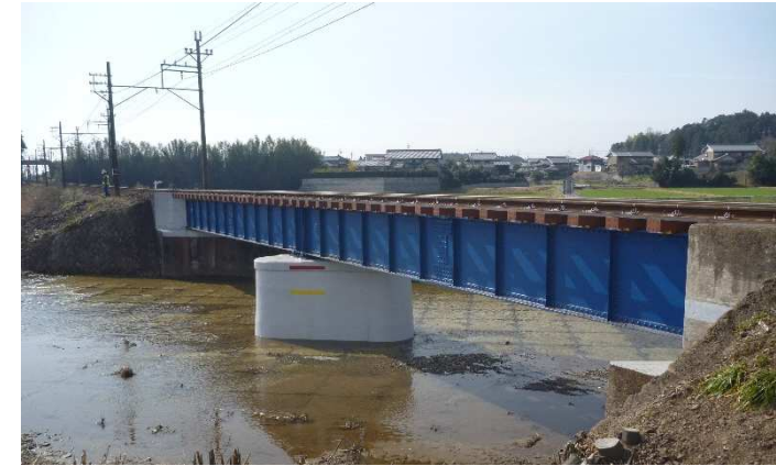
三岐線 源太川橋梁改修工事