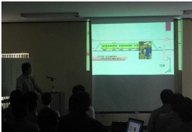
安全大会（職場安全活動の発表）