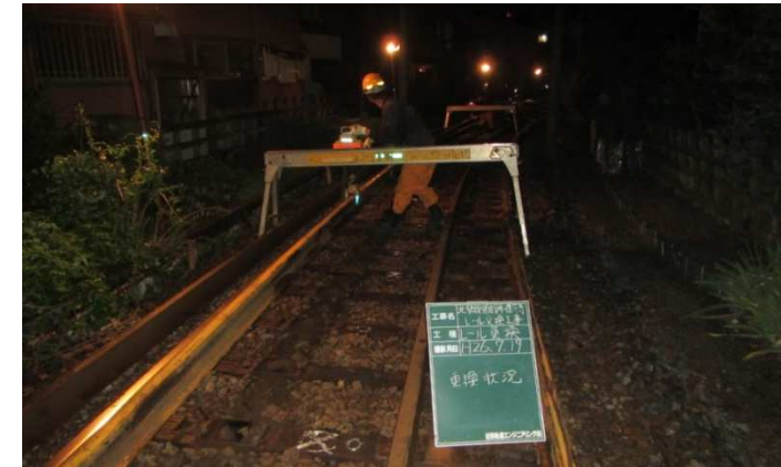
北勢線 蓮花寺川橋梁レール交換工事