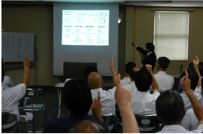
会社主催安全大会