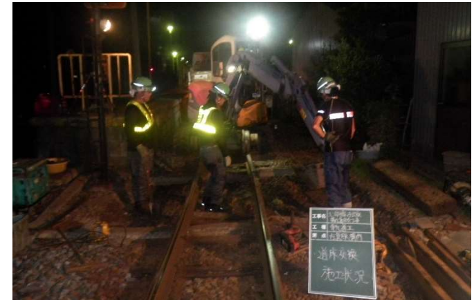
北勢線 在良駅構内道床交換工事