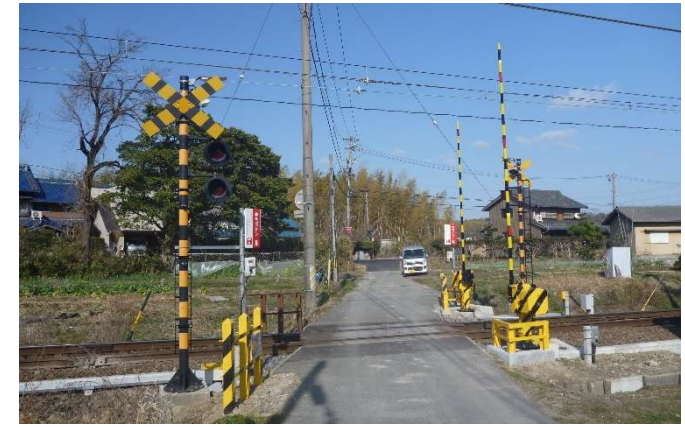
三岐線 踏切道一種化工事(萱生2号)