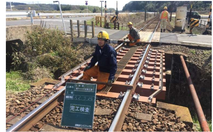
三岐線 橋梁マクラギ交換工事