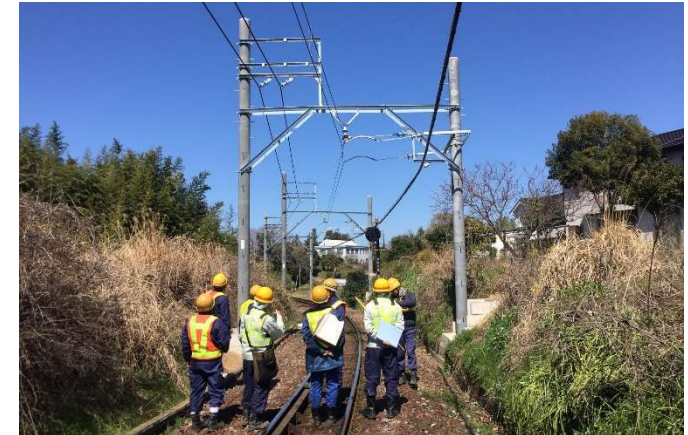
北勢線 電路柱建替工事