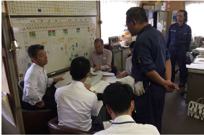
内部監査実施状況

当社では鉄道部門の安全管理体制の点検活動の一つとして、総務部長を監査責任者とする内部監査を毎年8月に実施しており、安全管理体制の強化並びに改善を図っています。